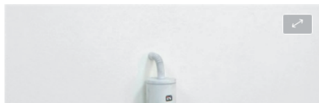
Bidibidibidiboo, una obra de Cattelan que representa a una ardilla suicida

En abril de este año presentó una versión de Eternity en la Academia de Bellas Artes de Carrara, donde estudiantes de arte realizaron lápidas en honor a artistas vivos y muertos como Jeff Koons, René Magritte y Marcel Duchamp. Sobre la tumba ficticia de Cattelan se veía la escultura de un perro haciendo sus necesidades.