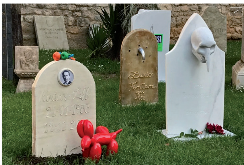
La versión de Eternity en Carrara, con lápidas dedicadas a Jeff Koons y Lucio Fontana