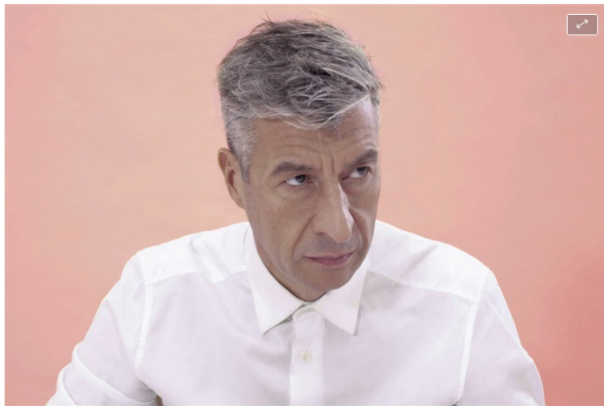
Maurizio Cattelan, uno de los artistas contemporáneos más cotizados del mundo

"En Italia, cuando soñamos que alguien se muere decimos que le estamos alargando la vida. Así que espero que Eternity prolongue la vida de mucha gente", explica uno de los artistas contemporáneos más cotizados del mundo, famoso por sus provocativas esculturas hiperrealistas.