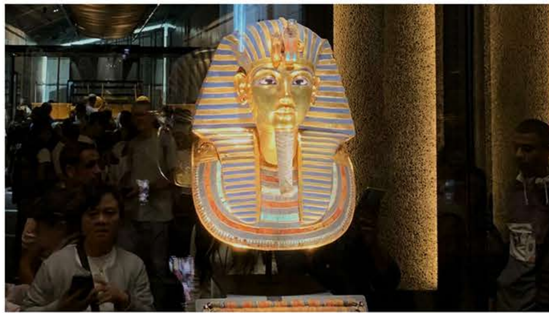
La máscara de Tutankamón, expuesta por primera vez en el Gran Museo Egipcio.

Sherif Fathy no deja de sacar pecho de la inauguración, mencionando la visita del rey de España, Felipe VI. "Las relaciones entre Egipto y España son fuertes", menciona. "Muchos turistas y arqueólogos españoles que estaban allí ese día no paraban de acercarse para sacarse selfies con él". Una de las ventajas es lo muy cerca que está de las Pirámides de Giza, el principal reclamo del país. "Prácticamente, el 99% de las visitas acuden a los dos monumentos. Hay distintas rutas, y al margen hemos construido un nuevo puente de conexión que todavía no está abierto".