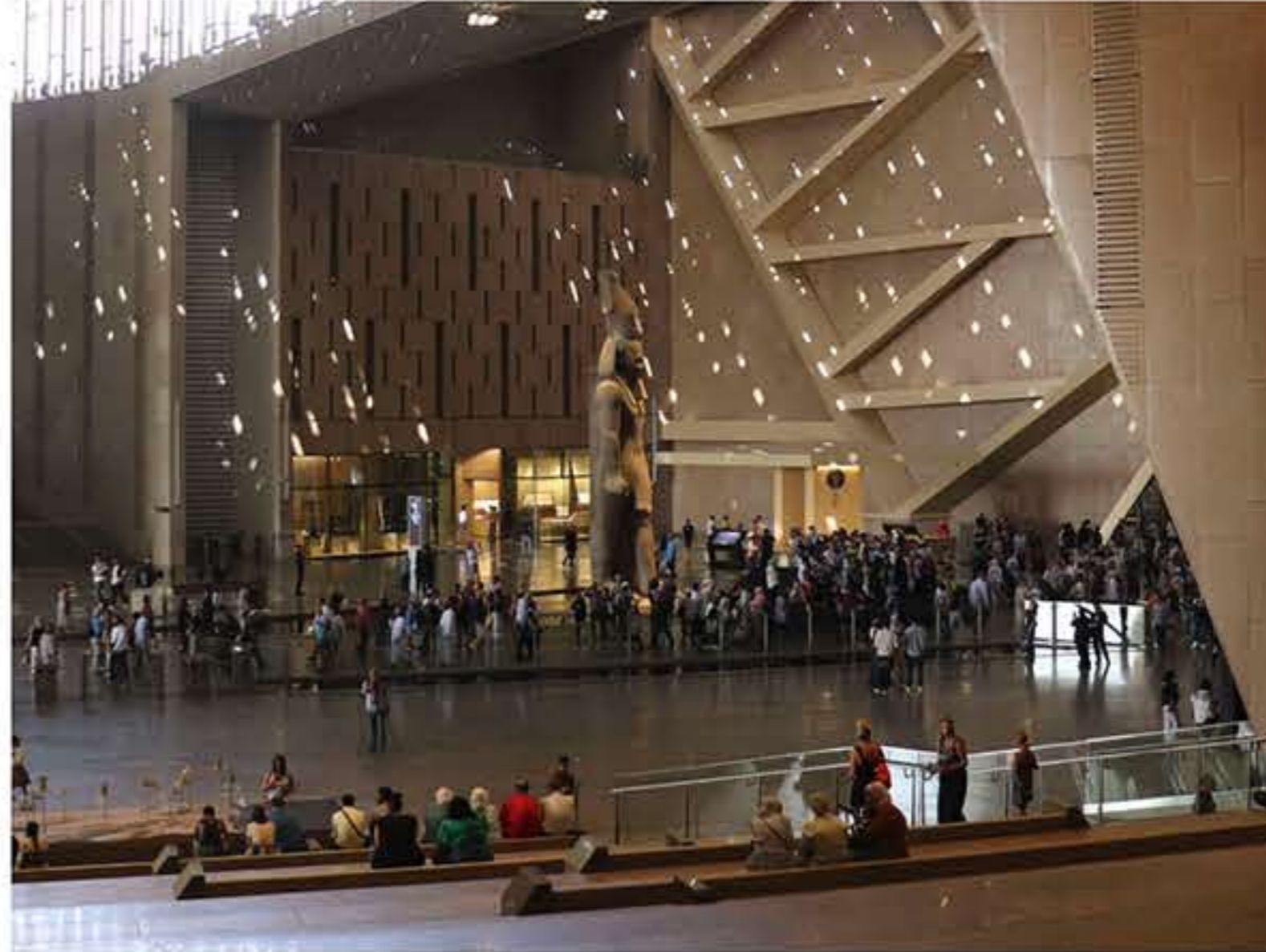
Entrada al Gran Museo de Egipto, joya de la arqueología mundial.

El país de Oriente Medio espera aumentar su número de visitantes este año después de la esperada apertura del complejo museístico. Hablamos con el ministro de Antigüedades y Turismo tras su paso por FITUR